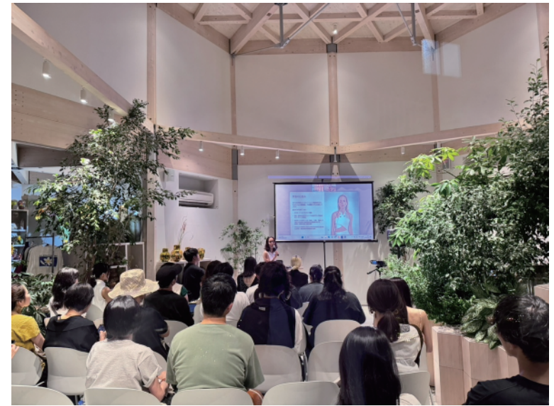
代官山 Cirtyでの開催回より。ヴィーガン軽食など、五感で感じるコンテンツの提供も