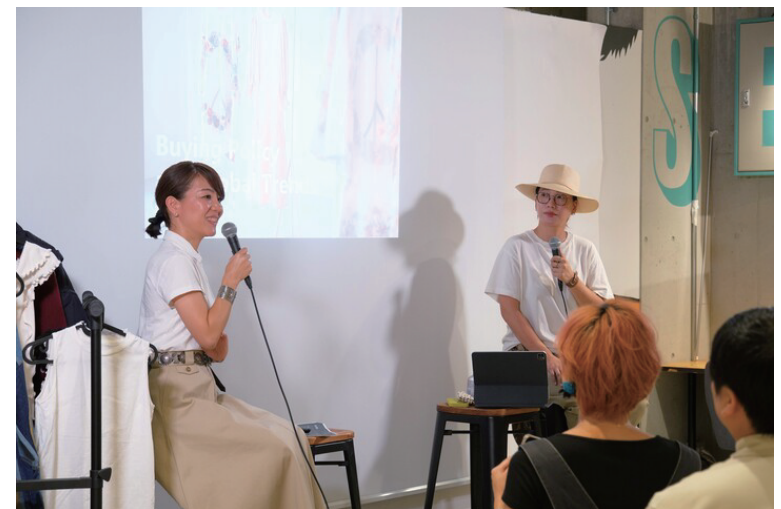
ロンハーマンディレクター登壇回より。会場・オンラインで130人が参加